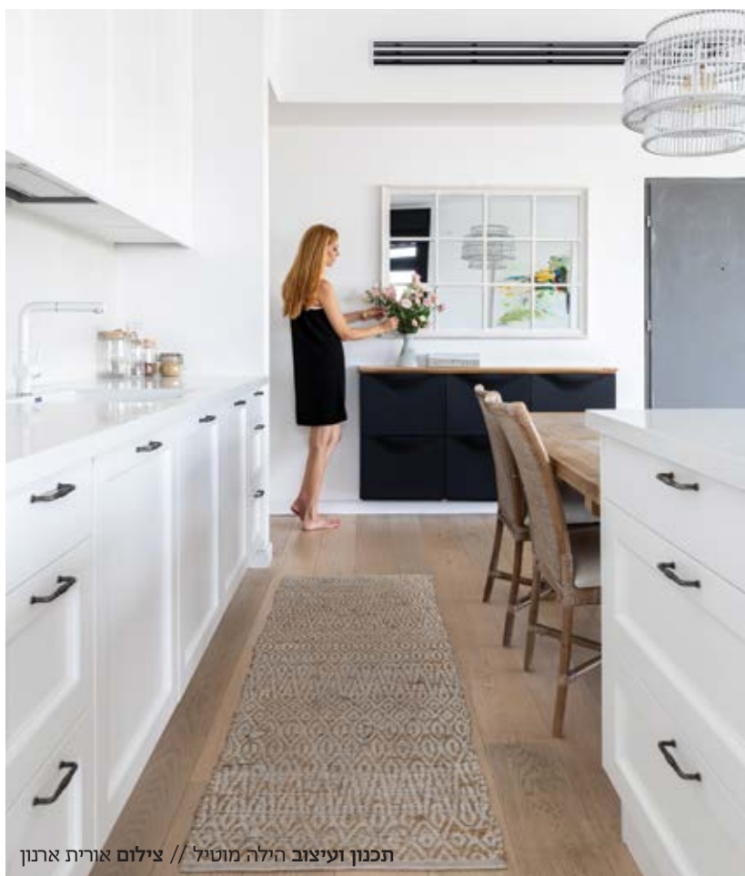
תכנון ועיצוב הילה מוטיל

הלבן נחשב מאז ומתמיד לפופולרי ביותר בעיצוב הפנים: הוא משרה תחושת ניקיון, חגיגות, וקלאסיות, מבטא את האור ומשתלב בהרמוניה עם כל קשת הצבעים