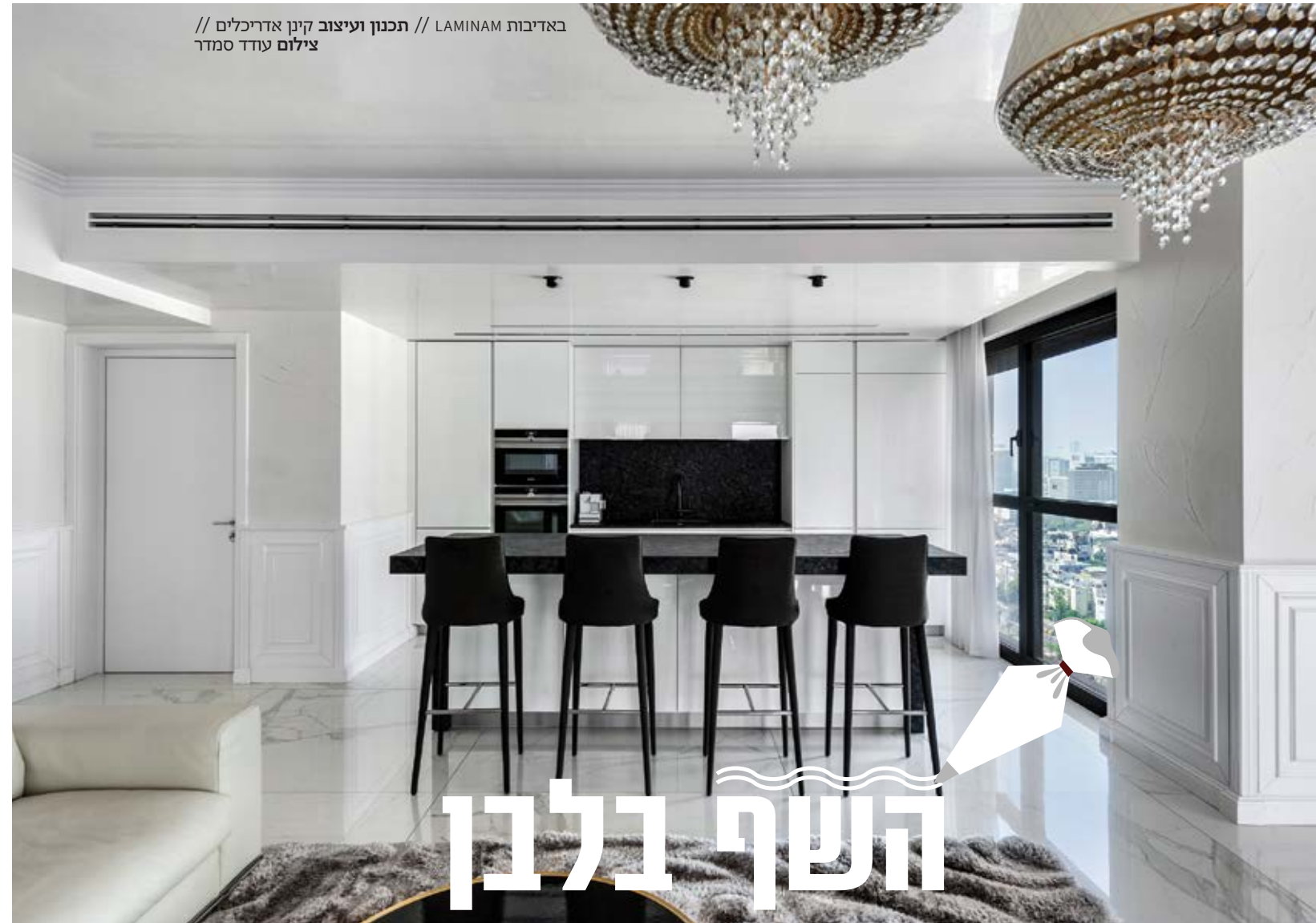
תכנון ועיצוב קינן אדריכלים